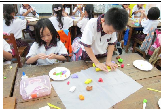
實際動手玩食物捏塑，提升對食物的喜愛