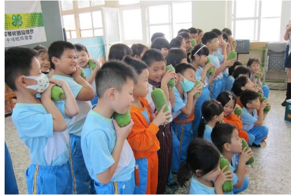
看一看~摸一摸~聞一聞~