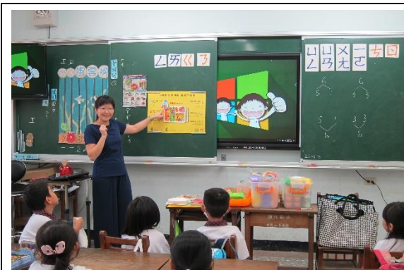
一智生活課程帶入「我的餐盤聰明吃」