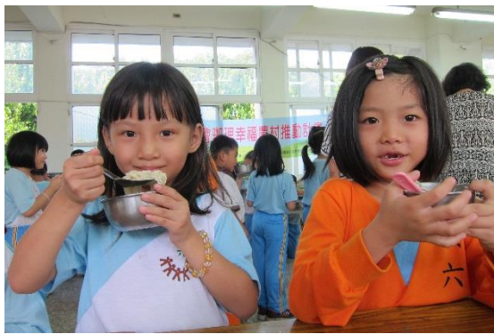
自己參與過程的絲瓜~最好吃!