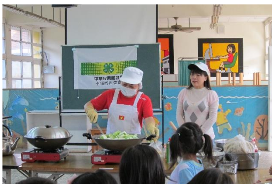
看廚房媽媽煮絲瓜