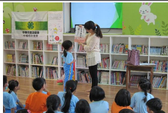
找一找這包米有沒有三章一Q標章?