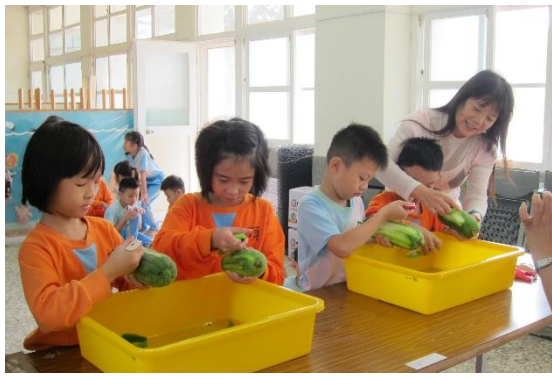
食農教育~體驗刨絲瓜