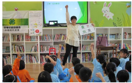
生活中在哪裡還可以看到?