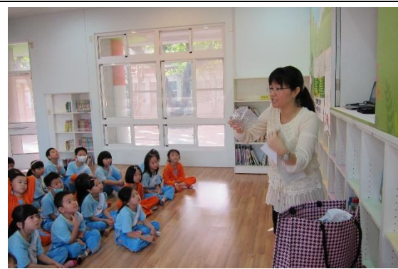
找一找~三章一Q在哪裡?