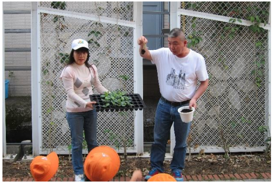
食農教育~青農介紹絲瓜苗