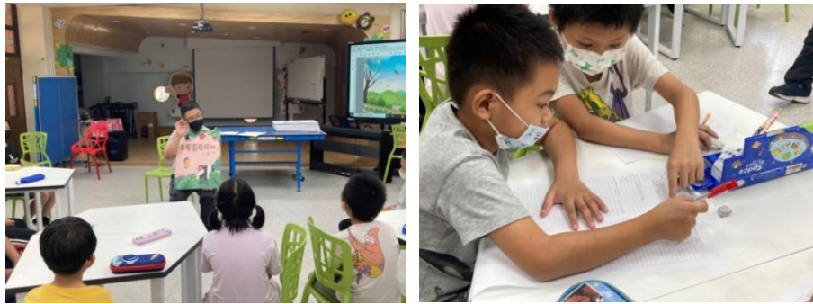
圖 1 認識草莓園裡的動物及建立書籍閱讀的重點紀錄

位於大湖鄉武榮社區的武榮農場，分局從 106 年協助生態監測至今，發現了 16 種保育類動物，是全臺少數友善環境與生態保育的露天草莓園，也成為慈心發展基金會中部綠保田示範區，而周邊的武榮國小全校人數僅 11 位，發現其在地學生對於自身家鄉不了解，且多數缺少自信心，因此希望透過在武榮農場所建立的友善環境資源，持續深耕至在地的學校培養為小小導覽員，因此結合學校課程安排 3 堂課，認識在地環境、生態、環境保育，啟發學子對自己的鄉土資產關注及熱情，認同自己的家鄉，能培養孩子面對人群與口語表達能力。