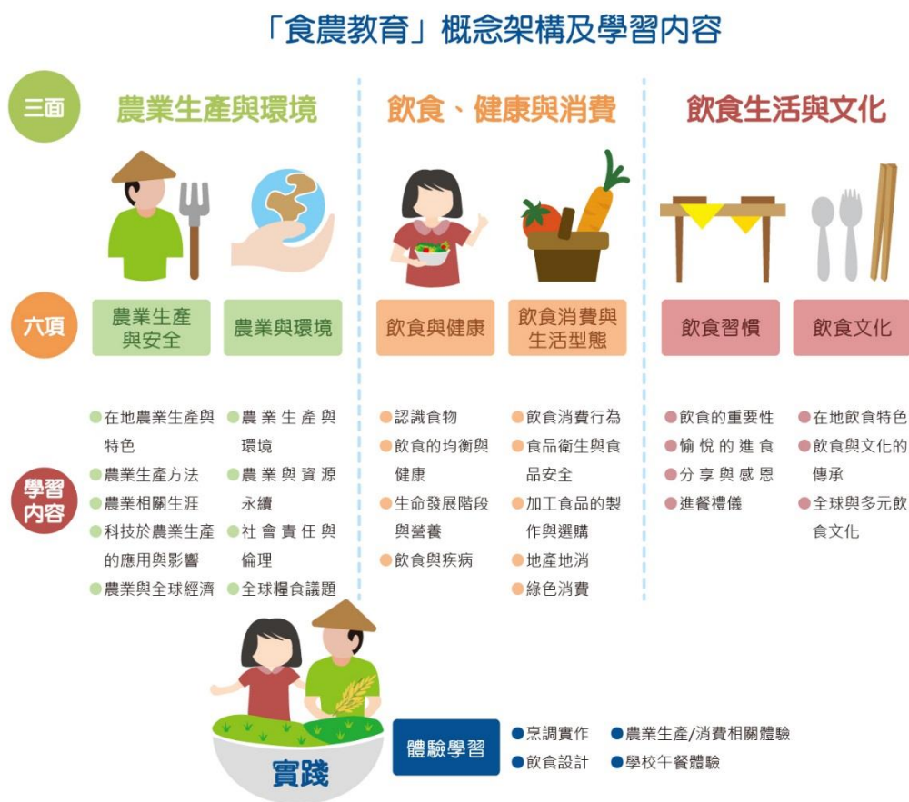
表 1 食農教育推廣架構

「食農教育推廣架構」(表 1) 為本計畫食農教育活動規劃及教案設計之指引參考，以協助各申請單位聚焦推動食農教育，並銜接學校相關之領域課程。除規劃及執行食農教育的課程教案與活動，各申請單位尚須辦理內部訓練，並參與本計畫辦理之培訓及接受評核，以累積推廣能量。