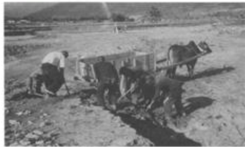
榮民搬運泥土改善土質.....提供台東農業發展中心